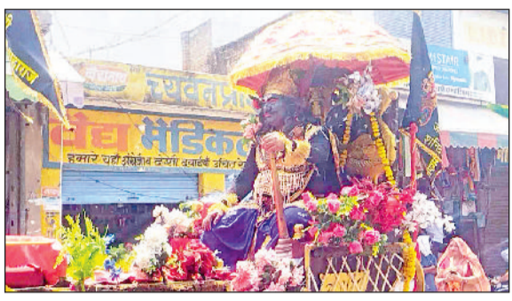
महेन्द्रगढ़। शहर में शोभायात्रा के दौरान शनिदेव की वेशभूषा में कलाकार। व महेन्द्रगढ़। जागरण में अपनी प्रस्तुति देते कलाकार।