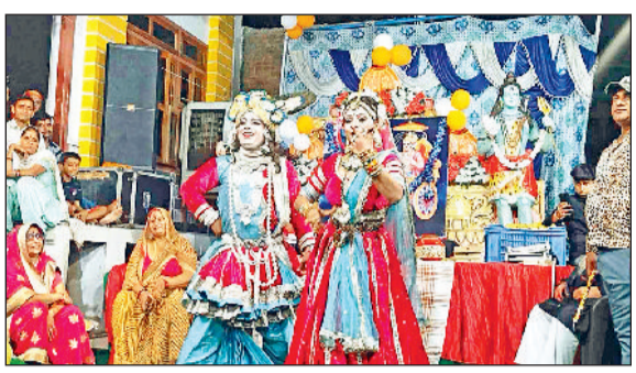
महेन्द्रगढ़। शहर में शोभायात्रा के दौरान शनिदेव की वेशभूषा में कलाकार। व महेन्द्रगढ़। जागरण में अपनी प्रस्तुति देते कलाकार।