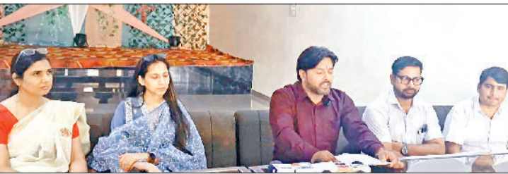
नारनौल। प्रेसवार्ता को संबोधित करते एसोसिएशन कोर कमेटी सदस्य।

पत्रकारवार्ता में प्ले स्कूल एसोसिएशन के जिला प्रधान ने कहा कि प्ले स्कूल शिक्षा विभाग के अंडर नहीं आते। प्ले स्कूल महिला एवं बाल विकास विभाग के अंडर आते हैं तथा जिले के लगभग सभी प्ले स्कूल लगातार कई सालों से महिला एवं बाल विकास विभाग से मान्यता ले रहे हैं, लेकिन इस बार प्राइवेट प्ले स्कूलों ने शिक्षा विभाग पर अनुचित दबाव बनाकर प्ले स्कूलों की विजिट संबंधित बोर्डों