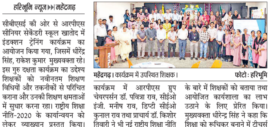
महेन्द्रगढ़। कार्यक्रम में उपस्थित शिक्षक।