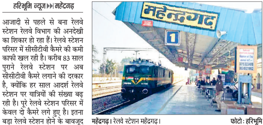
महेन्द्रगढ़। रेलवे स्टेशन महेन्द्रगढ़।

आजादी से पहले से बना रेलवे स्टेशन रेलवे विभाग की अनदेखी का शिकार हो रहा है। रेलवे स्टेशन परिसर में सीसीटीवी कैमरे की कमी काफी खल रही है। करीब 83 साल पुराने रेलवे स्टेशन पर अब सीसीटीवी कैमरे लगाने की दरकार है, क्योंकि हर साल आदर्श रेलवे स्टेशन पर यात्रियों की संख्या बढ़ रही है। पूरे रेलवे स्टेशन परिसर में केवल दो कैमरे लगे हुए हैं। इतना बड़ा रेलवे स्टेशन होने के बावजूद दो सीसीटीवी कैमरे से संदिग्ध व्यक्तियों की निगरानी भी नहीं हो पा रही है। अगर रेलवे स्टेशन पर कोई आपराधिक वारदात हो जाए तो उसे सुलझाने के लिए यहां कोई सीसीटीवी नहीं लगा है। अगर स्टेशन पर सीसीटीवी लगे हो तो आरपाधिक क्रिमि से लोगों में भी डर बना रहेगा कि उनकी हरकत कैमरे में कैद हो सकती है। वहीं,