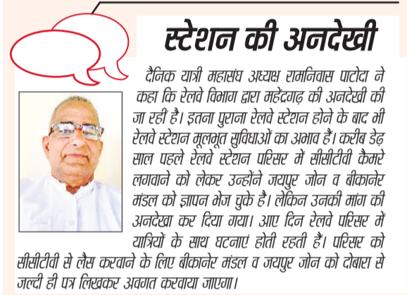
महेन्द्रगढ़। रेलवे स्टेशन महेन्द्रगढ़।

आजादी से पहले से बना रेलवे स्टेशन रेलवे विभाग की अनदेखी का शिकार हो रहा है। रेलवे स्टेशन परिसर में सीसीटीवी कैमरे की कमी काफी खल रही है। करीब 83 साल पुराने रेलवे स्टेशन पर अब सीसीटीवी कैमरे लगाने की दरकार है, क्योंकि हर साल आदर्श रेलवे स्टेशन पर यात्रियों की संख्या बढ़ रही है। पूरे रेलवे स्टेशन परिसर में केवल दो कैमरे लगे हुए हैं। इतना बड़ा रेलवे स्टेशन होने के बावजूद दो सीसीटीवी कैमरे से संदिग्ध व्यक्तियों की निगरानी भी नहीं हो पा रही है। अगर रेलवे स्टेशन पर कोई आपराधिक वारदात हो जाए तो उसे सुलझाने के लिए यहां कोई सीसीटीवी नहीं लगा है। अगर स्टेशन पर सीसीटीवी लगे हो तो आरपाधिक क्रिमि से लोगों में भी डर बना रहेगा कि उनकी हरकत कैमरे में कैद हो सकती है। वहीं,