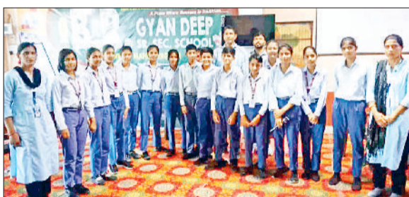
महेन्द्रगढ़। प्रतियोगिता में भाग लेते विद्यार्थी।