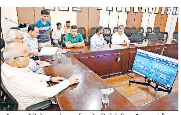
महेन्द्रगढ़। हर्केवि में स्नातकोत्तर कार्यक्रम में दाखिले के लिए ऑनलाइन पंजीकरण का पोर्टल का शुभारंभ करते कुलपति।

प्रवेश परीक्षा में सफल परीक्षार्थियों को शुभकामना देते हुए उनके उज्वल भविष्य की कामना की और कहा कि हरियाणा केंद्रीय विश्वविद्यालय देशभर के अभ्यर्थियों का स्वागत करता है और उनके