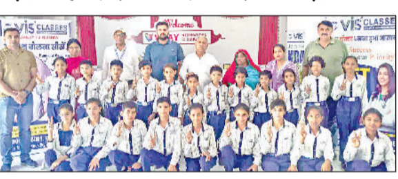
महेन्द्रगढ़। विजय विहन बनाकर खुश जाहिर करते विद्यार्थी।