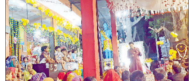
मंडी अटेली। श्री शनिदेव धाम फतेहपुर में जागरण में भाग लेते श्रद्धालु।