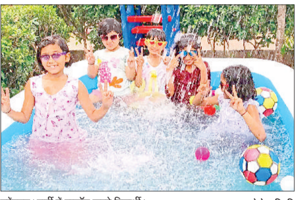
महेन्द्रगढ़। पार्टी में एन्जॉय करते विद्यार्थी।